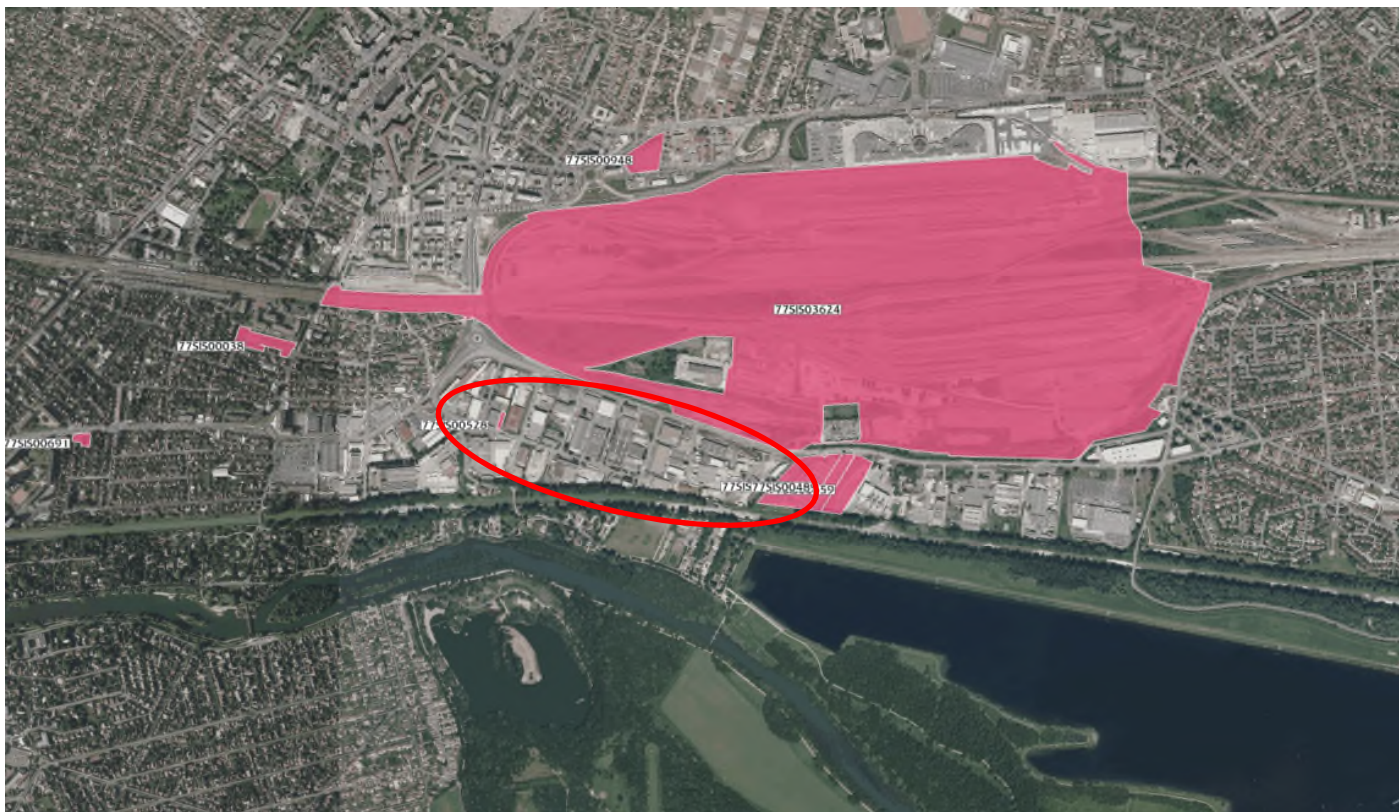
Secteur d'information sur les Sols (SIS)